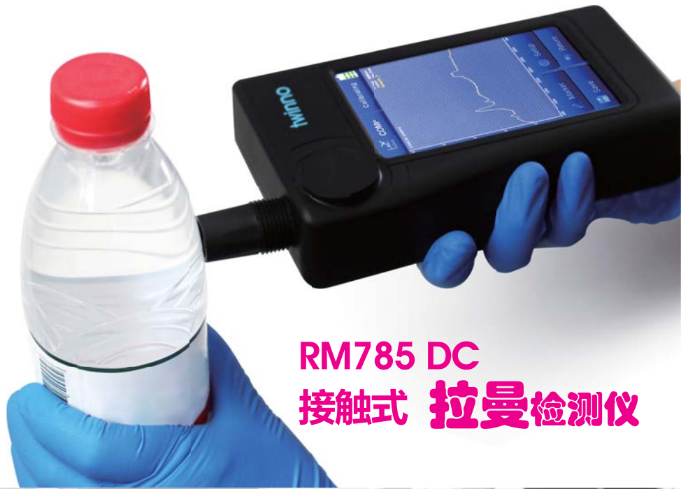
RM785 DC 接触式 拉曼检测仪

地铁、火车站、机场等安全检查； 海关、警察、军方等物品检查； 企业、生产线等产品质量检测。